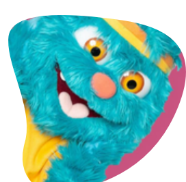
יוגיפלט- לגיל הרך