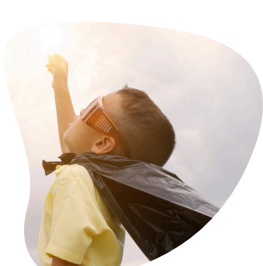
דמיון מודרך - להרגיע דאגות ופחדים